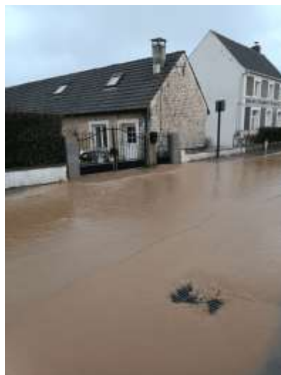
Route de Caffiers le 16 janvier 2023

Grand Calais Terres et Mers qui a la compétence « Assainissement, eaux pluviales » a lancé une étude hydraulique pour l'aménagement du bassin versant de la communauté d'agglomération pour lutter contre les ruissellements et l'érosion des sols. Démarrage de cette étude le 29 novembre 2022.