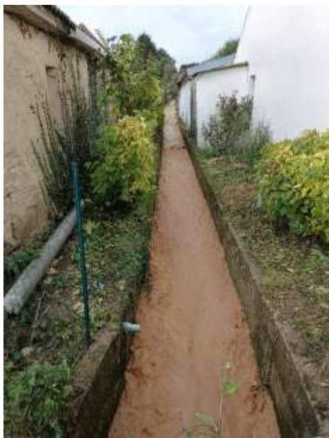
Ecoulement en aval du bassin le 28 octobre 2023