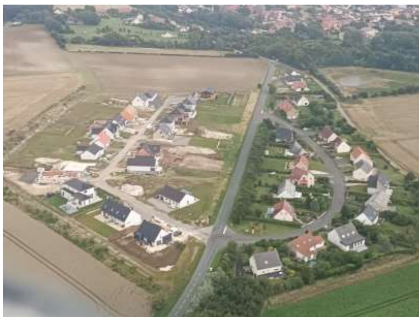
La résidence des « Jardins de la Rocherie » à gauche faisant face à la résidence de la Côtère

Actuellement, sur les 24 parcelles, 22 habitations sont occupées ou en construction.