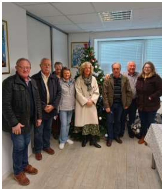
Les membres du C.C.A.S. partant pour la distribution des colis

Les 6 membres du personnel se sont aussi vus offrir ce colis.