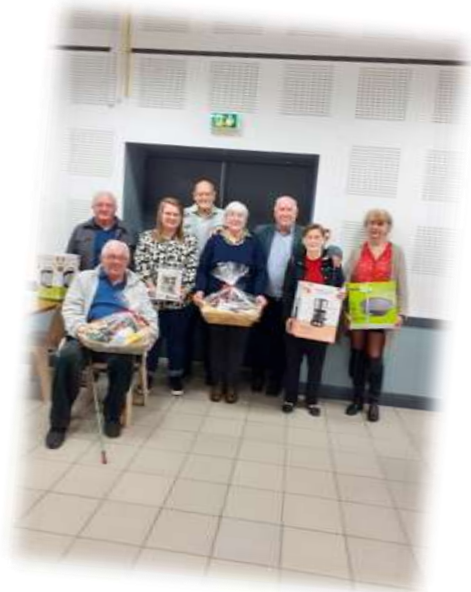
Belote, rebelote et dix de der, le temps d'un après-midi à la salle des fêtes