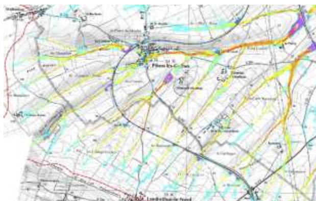
En jaune, les axes de ruissellement sur le territoire de Pihen-lès-Guînes

Dans les zones agricoles, le ruissellement lié à de fortes précipitations entraîne le départ des terres par érosion de façon spectaculaire en creusant de profondes ravines ou plus discrètement en emportant les éléments fertiles du sol.