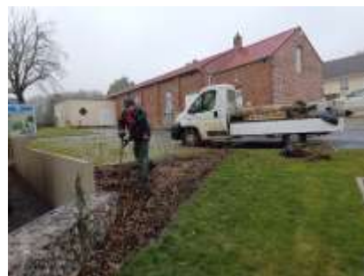
Plantations aux abords de la salle des fêtes