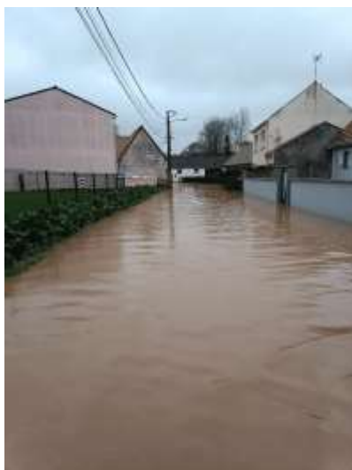
Rue du Château le 16 janvier 2023

Durant l'année 2023, la communauté d'agglomération a connu des épisodes de crues, les pentes importantes sur le territoire de notre commune favorisent la production du ruissellement, l'eau n'a pas le temps de s'infiltrer dans les sols et se met alors rapidement en mouvement. Nous recevons aussi l'eau des communes voisines qui ne font pas partie de la même intercommunalité, cette eau vient nourrir et accentuer le ruissellement, de plus elle alimente les communes situées en aval qui subissent les inondations.