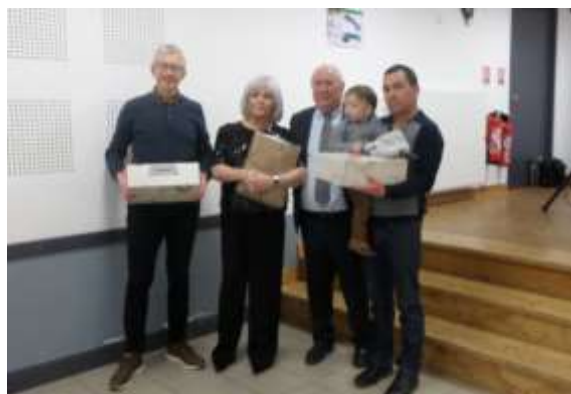
Les gagnants de la tombola

Merci à tous pour ce joli moment de convivialité à l'orée des fêtes de Noël.