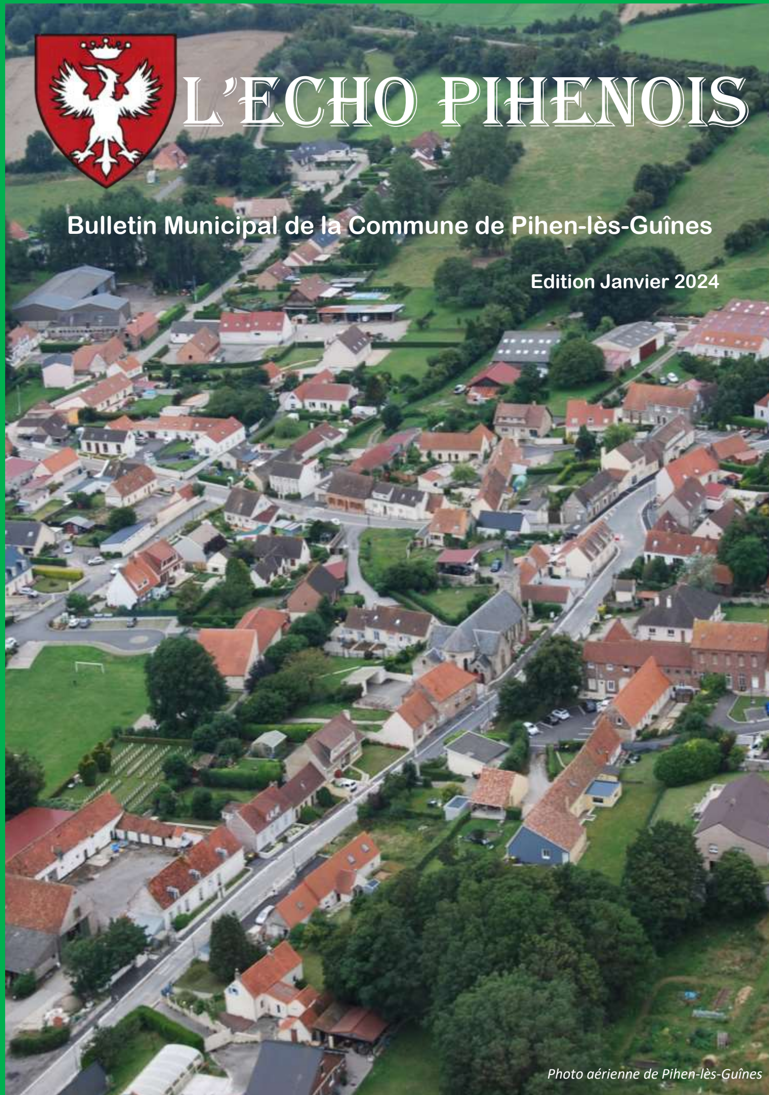
Photo aérienne de Pihen-lès-Guînes