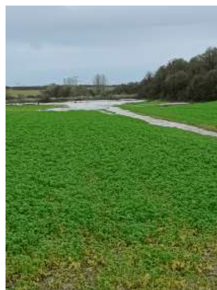
Bassin de la ferme d'Alenthun le 9 novembre 2023

Les ouvrages d'hydraulique douce ont un rôle prépondérant dans les épisodes pluvieux inférieur à 10mm/h de durée limitée, les ouvrages structurants comme les bassins de rétention sont nécessaires pour une pluviométrie supérieure, pour les événements extrêmes d'autres outils comme le plan de prévention des risques d'inondation ont un rôle à jouer afin de limiter la vulnérabilité des territoires.