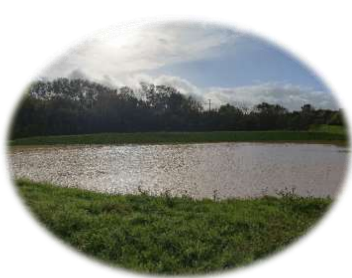
Bassin de rétention route de Saint-Inglevert le 28 octobre 2023

Durant la période estivale en France, des régions souffrent de pénurie d'eau, leurs nappes phréatiques sont particulièrement basses. Pour pallier ce phénomène de plus en plus fréquent, il faut favoriser l'infiltration. La meilleure eau pluviale est celle qu'on ne rejette pas.